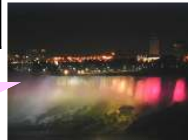
ナイアガラライトアップイメージ図

※レストランからナイアガラの夜景は見えません。食事の前又は後にナイアガラの夜景を見に行きます。